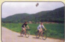
Lac du Forlet - P. Bergmiller - PNRBV