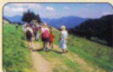
Randonnée Rossberg